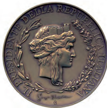
Medaglia conferita dal Presidente della Repubblica quale “premio di rappresentanza all'edizione 2010”

Nel solco tracciato da Snow, Biogem ospita annualmente il Meeting “Le Due Culture”. Quest'anno, nel 150° anniversario dell'Unità d'Italia, ricercatori provenienti da discipline e punti di vista diversi si confronteranno sul contributo che umanisti e scienziati hanno dato e promettono di dare alla crescita e alla coesione nazionale.